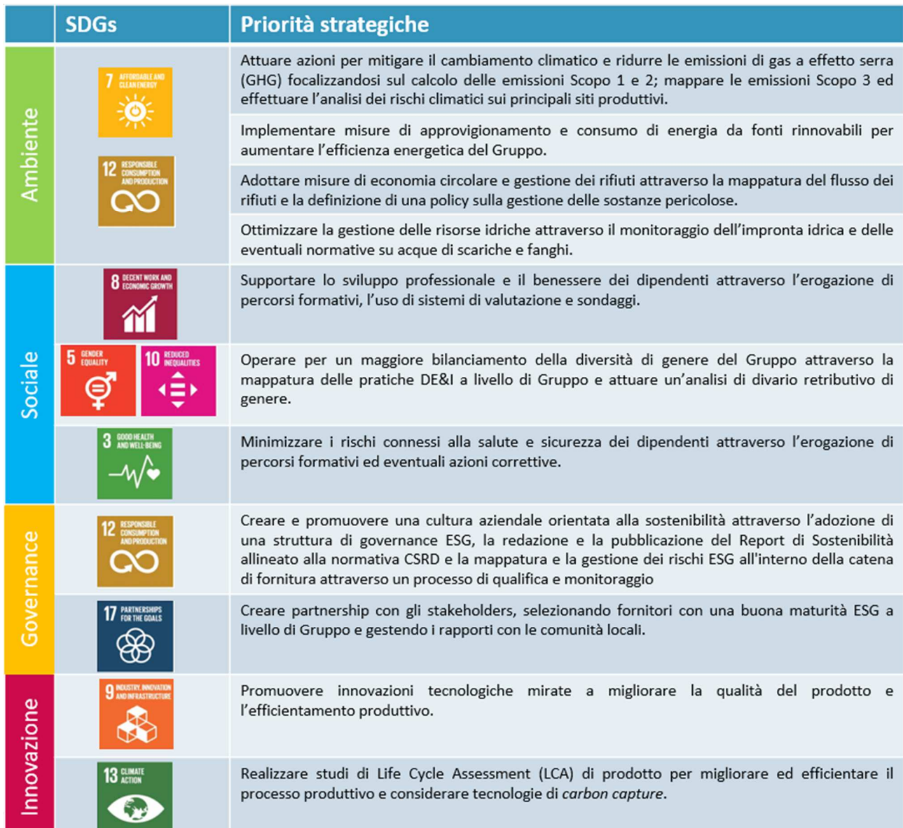
Tabella 1: Obiettivi Di Sviluppo Sostenibile integrati all'interno della strategia di sostenibilità di Acciaierie Valbruna